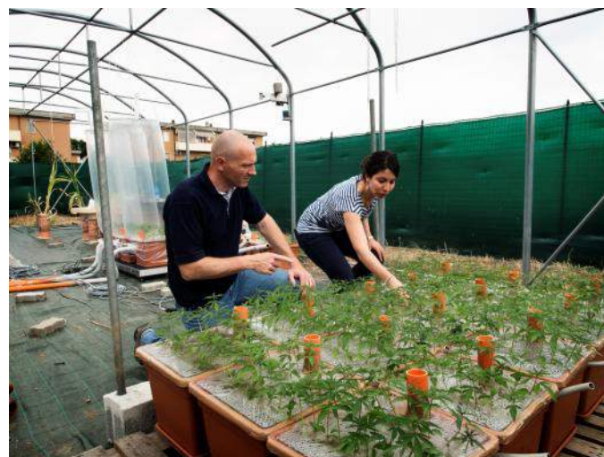
Ricercatori dell'Università Cattolica del Sacro Cuore (Piacenza) impegnati nel progetto europeo MULTIHEMP

facilitare l'accesso al credito per questi soggetti economici attraverso strumenti di garanzia e microfinanza. In particolare, come in questo caso, si cerca di sostenere imprese altamente innovative che possano fornire un alto valore aggiunto a livello sociale ed economico.