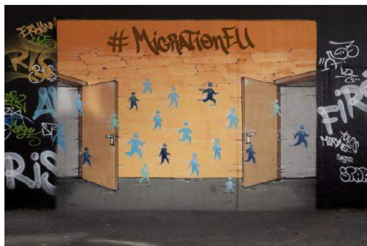
Ottava priorità della Commissione Juncker “Verso una nuova politica in materia di immigrazione”

Dall'incontro saranno tratte interviste a stakeholder qualificati che confluiranno in un breve video destinato a diffondere tale messaggio a livello nazionale ed europeo.