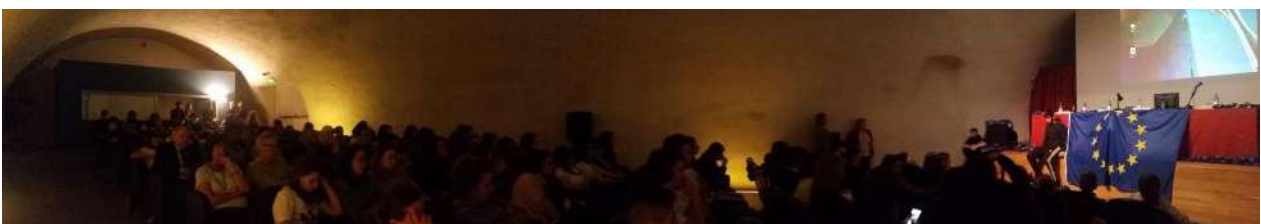
Auditorium del Galata-Museo del Mare: un momento dello spettacolo "Di ferro e di speranza"

Gli Istituti Comprensivi hanno presentato i loro lavori sull'Anno europeo del Patrimonio culturale, che hanno colpito in pieno l'obiettivo di rafforzare il senso di appartenenza a uno spazio comune europeo: nelle prossime pagine presentiamo alcuni lavori compiuti dalle scuole genovesi.