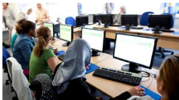
Lezione d'informatica in Germania in un corso cofinanziato dal Fondo europeo d'integrazione

Vero e falso. Su un totale di 1,2 milioni di richieste di asilo nell'UE nel 2016, il 60% sono state registrate in Germania, il 10% in Italia, il 6% in Francia e il 4% in